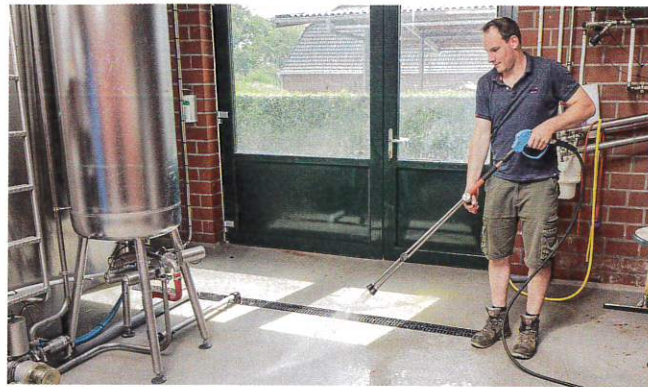
Die erste Zapfstelle befindet sich direkt im Technikraum, in dem auch der stationäre Hochdruckreiniger neben dem Milchtank platziert ist.

Angesprochen auf die mit dem stationären Gerät einhergehenden Effekte führen die Tombergs mehrere Punkte auf. So ist der