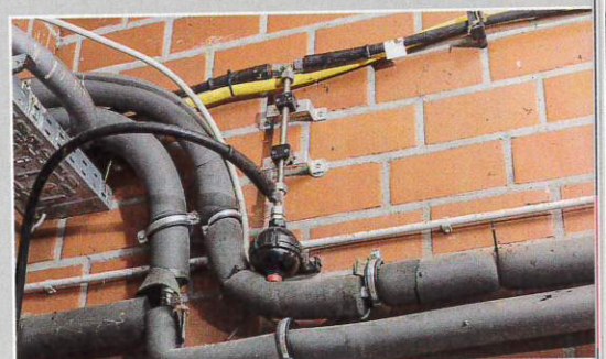
Der Druckspeicher verhindert ein lautes Schlagen beim Schließen der HD-Pistole.