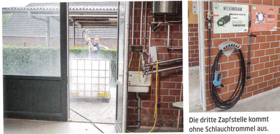
Die dritte Zapfstelle kommt ohne Schlauchtrommel aus.

den, lag der Lieferung ein heute 225 Euro teurer Druckspeicher bei. Zum Dämpfen von Druckspitzen in der HD-Leitung wird der Druckspeicher entweder am Ende der Leitung oder in der Nähe des Hochdruckreinigers installiert.