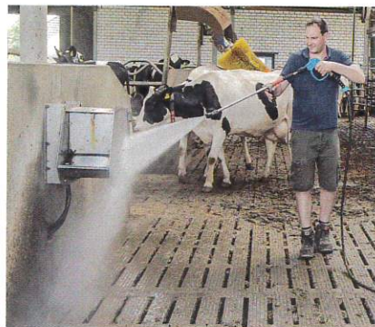
Die Schlauchlänge reicht problemlos für eine Reinigung der Tränkebecken aus