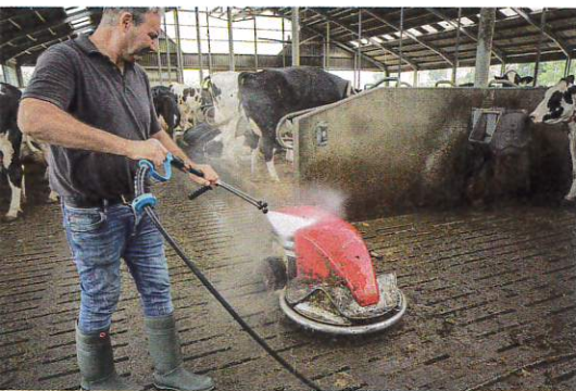
Nichts einfacher als das: Ab und an hat auch der Spaltenschieber eine Reinigung nötig.

„Wir benutzten dafür zwar schon ein Profi-Gerät – mit wenig Druck und einer hohen Wasserleistung. Das ständige Auf- und Abbauen der Strom- und Wasserversorgung beansprucht aber enorm Zeit, die wir eigentlich nicht haben.“