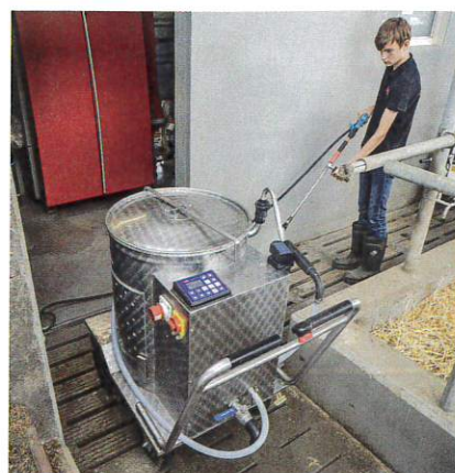
Auch das Milchtaxi kann im Gang vor den Melkrobotern äußerlich gereinigt werden.

Rüstungsaufwand für eine Reinigung nun deutlich reduziert. Denn um reinigen zu können, genügt heute ein Drücken der Hochdruckpistole – und schon beginnt die ständig betriebsbereite Technik das Arbeiten. Großen Gefallen finden die Landwirte aber auch daran, dass heute das Reinigen wesentlich leiser vonstattengeht. „Früher fingen die Tiere in der Melkbox regelmäßig das Zappeln an, wenn wir die Hochdruckpistole öffneten und parallel der mobile Hochdruckreiniger startete.