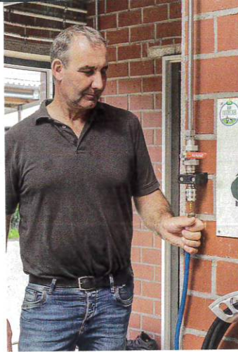
Ein Druckluftanschluss erlaubt das Leerblasen der Leitung bei Frost.

Und um ein lautes Schlagen der Hochdruckleitung beim Schließen der Hochdruckpistole zu unterbin-