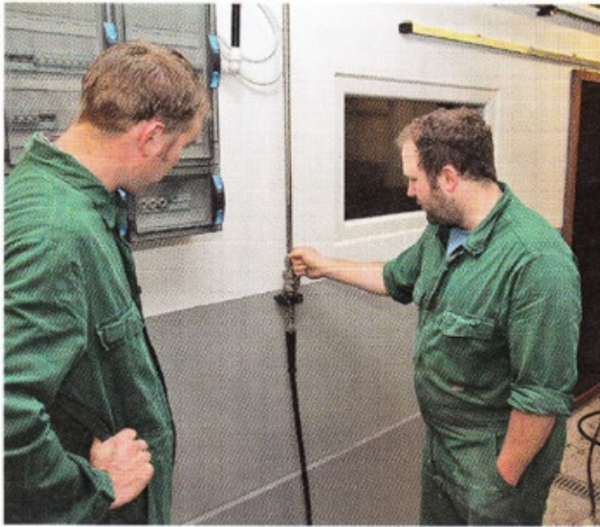
Bequemer geht's nicht: Der Gummischlauch des Hochdruckreinigers wird vor dem Abteil an die Zentraleitung angeschlossen.