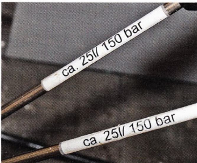
Die Reinigungslanzen sind mit Aufklebern versehen. So weiß jeder genau, welche Düse gerade im Einsatz ist.

Dafür spricht insbesondere der deutlich geringere Rüstaufwand. Denn Dietz und sein Team müssen vor dem Start der Reinigungsarbeiten vor den Stallabteilen nur die 30 m langen Gummischläuche an die zentrale Hochdruckleitung anschließen und schon kann das Säubern der Ställe starten. Um die Hochdruckpumpe müssen sie sich nicht kümmern. Denn sie