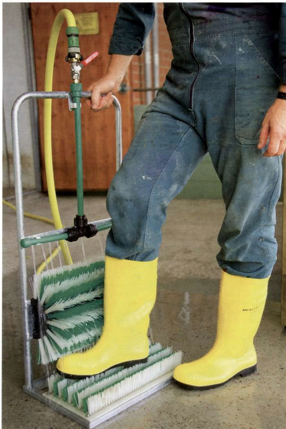
Die Stiefelbürste von Schurr punktet durch stabile und einfach verlegte Wasserleitungen sowie die guten Reinigungsbürsten.