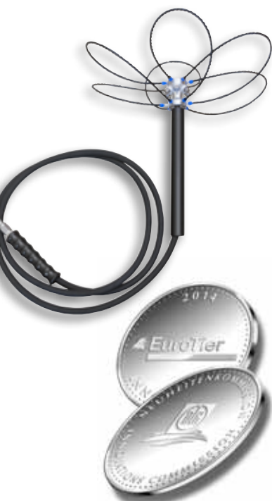
Als Gebrauchsmuster eingetragen